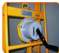
Detalhe do sistema de Acionamento Manual